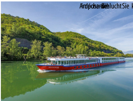
Arles entdecken Sie können heute

Das Tal der Rhône ist wie kaum eine andere Landschaft Europas, überaus reich an üppiger Architektur und historischen Schätzen, seit die Römer hier Städte gründeten, Wein anbauten und Handel betrieben. Von der hübschen alten Seiden-Handelsstadt Lyon reisen Sie zunächst flussabwärts Richtung Provence. Hier erwarten Sie sonnenverwöhnte Natur, bunte Landschaftsbilder, duftende Rosmarinsträucher, Wildpferde und römische Relikte inmitten von endlos wirkenden Lavendelfeldern. Auch die historischen Städte Avignon mit dem beeindruckenden Papstpalast und Arles mit dem berühmten Amphitheater werden Sie begeistern. Flussaufwärts geht es in das rustikale Weinbaugebiet Burgund, wo die berühmtesten Reben der Welt gedeihen. An ausgewählten Terminen können Sie ein alternatives Ausflugspaket buchen und so Ihre Reise in eine kulinarische Themenreise verwandeln, die Sie Frankreich mit allen Sinnen genießen lässt. Sie erfahren bspw. wie der schmackhafte Cassis Likör aus der Schwarzen Johannisbeere hergestellt wird oder besuchen ein Landgut aus dem 17. Jahrhundert und verkosten typischen Ziegenkäse aus eigener Herstellung.